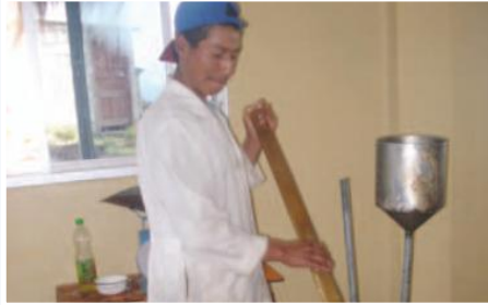
Producción de turrone

Entidades Participantes: Funorsal-Junta Parroquial de Salinas.