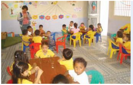
Refuerzo escolar a niños beneficiarios

Entidad Solicitante y Participante: Vicaría de Educación de la Arquidiócesis de Portoviejo.