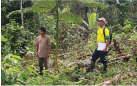
Módulo agroforestal Comunidad Encañada, especie Pachaco.

Entidades Participantes: Municipio de Mera, Junta Parroquial Madre Tierra, Asociación la Delicia, Productores de fruta de Madre Tierra, Fundación Ambiente y Sociedad.