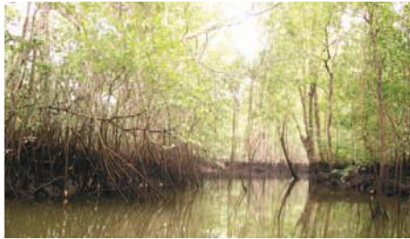
La belleza del manglar

Entidades Participantes: A. de Cooperación Rural en África y América Latina ACRA, Corporación Coordinadora Nacional para la Defensa del Ecosistema Manglar C-CONDEM, A. de Mujeres de Juntas Parroquiales Rurales del Ecuador AMJUPRE; Fed. de Usuarios Ancestrales del Ecosistema del Manglar y Bosque Húmedo Tropical del cantón Muisne FUEMBOH-M.