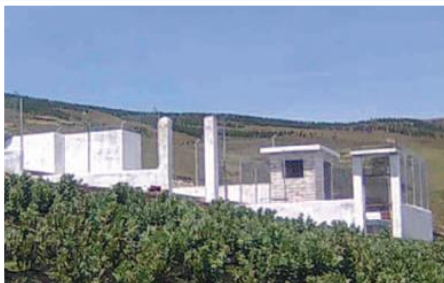
Tanque de reserva y sistema de cloración

De la encuesta realizada a finales de marzo 2008, por parte del equipo de promoción del Gobierno Municipal de Guamote, se dedujo que la población no disponía de servicio de agua potable; acarrear agua de mangueras que salen de las vertientes y no disponen de alcantarillado o de un sistema adecuado de depósito de desechos. El 23% de las viviendas disponen de letrina, la mayoría tienen pozas sépticas (67%). El 23% de las familias utilizan algún método para desinfectar el agua. Existía presencia de enfermedades diarreicas en