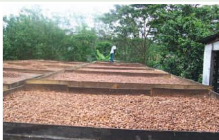
Marquesinas para secar cacao en el Centro de acopio de Maldonado.

El proyecto quiere incorporar 152 pequeños agricultores cacaoteros a la cadena de cacao de la APROCANE, mediante capacitación, asistencia técnica y financiamiento para nuevas siembras, manejo adecuado de fincas, cosecha, pos cosecha y comercialización conjunta.