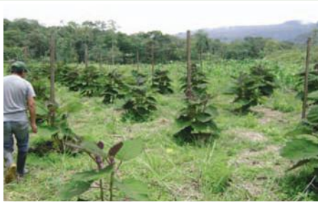
Parcela de naranjilla variedad INIAP 2009

Entidades Participantes: Ministerio de Agricultura Ganadería y Pesca MAGAP Nangaritza, Asociación del valle de Nangaritza, Gobierno Provincial de Zamora Chinchipe.