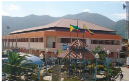
Mercado Municipal de Macará

Entidades Participantes: Gobierno Municipal de Macará, COSV, Asociación de Vivanderas de Macará, Cooperativa de Camionetas de Transporte Mixto Macará.