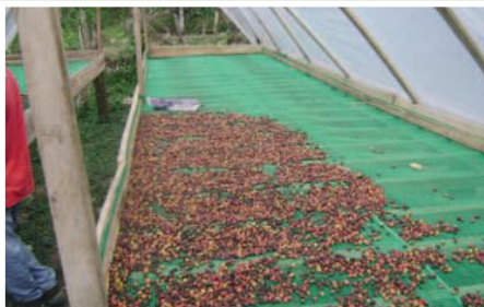
Marquesina para secado de café, cacao y maíz en el cantón el Pangui.

El propósito del proyecto es el mejorar los ingresos de 480 familias en el cantón el Pangui, apoyando en el fortalecimiento de emprendimientos al sector ganadero, porcicultor y agrícola. En el sector ganadero se trabaja en la capacitación para un manejo semiestabulado del ganado, se está trabajando en mejoramiento genético y de pastos lo cual contribuirá en una mayor y mejor cantidad y calidad de leche producida. Así también se ha apoyado a la construcción de un centro de acopio el mismo que está siendo equipado. En el sector porcicultor se está apoyando en el mejoramiento de las infraestructuras de manera que los animales se críen técnicamente y los desechos sean tratados previo su incorporación al ambiente. En lo relacionado con el área agrícola se está trabajando en cultivos de cacao, café para lo cual los productores han sido apoyados en la construcción o adecuación de marquesinas que les permita realizar un tratamiento poscosecha adecuado. Al grupo se les ha apoyado con la implementación y terminación del centro de acopio, así como también con la adquisición de un camión que permita el transporte adecuado y a tiempo de la cosecha que en la zona está siendo producida de una manera orgánica.