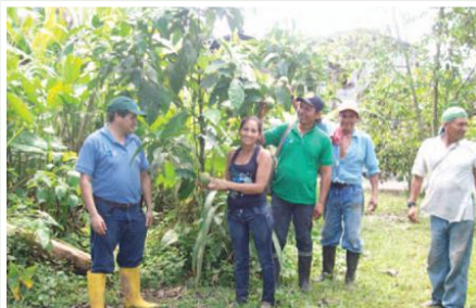
Asistencia técnica en fincas

recursos económicos, los mismos que están siendo parte de un proceso de capacitación, en la aplicación de tecnologías agroecológicas apropiadas, además cada beneficiario dispone de una hectárea de cacao, la misma que está sometida a un proceso de mejoramiento, mediante la asistencia técnica y la aplicación de prácticas agronómicas adecuadas. Para mejorar los ingresos de los agricultores se aplicará una comercialización asociativa, mediante el fortalecimiento y refacción del centro de acopio de la Y de Tipishca manejada por la organización de Agricultores CECOPAT. Para fomentar el ahorro se conformará una caja de ahorro y crédito comunitaria, las mismas que funcionará junto al centro de acopio, por lo que contarán con un capital semilla de arranque, cuyos aportantes, ahorristas o socios serán los beneficiarios del proyecto.