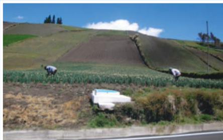
Tanque rompe presión sistema de agua potable Hualcanga

El proyecto se formuló para mejorar el servicio de agua potable para 12 comunidades de Hualcanga, en beneficio de 1.002 familias campesinas, mejorando las condiciones de salud y bienestar a través de mejorar y habilitar el sistema regional, a fin de ampliar la cobertura al 100% de las viviendas. En el área del proyecto según el Sistema de Indicadores Sociales de Ecuador (SISE 4.0 año 2.007), las parroquias Quero y particularmente Rumipamba, forman parte de las 200 parroquias más pobres del país (95% NBI), previo a la implementación del proyecto las viviendas tenían limitado acceso a los servicios básicos y en condiciones inadecuadas. La calidad del agua no era la adecuada y el caudal era insuficiente para satisfacer la demanda de las familias. Para la ejecución del proyecto se formó la Unidad Ejecutora conformada por: Ilustre Municipio de Quero, Junta Regional de agua potable Hualcanga y los socios.