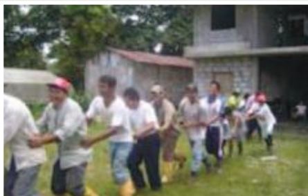
Dinámica grupal en curso de capacitación

rurales del cantón Lago Agrio. En la cadena Cacao, el proyecto brindará asistencia técnica para el mejoramiento de 400 Ha ya establecidas de cacao nacional y se certificarán 200 fincas con sello orgánico. Con la finalidad de asegurar la comercialización asociativa se prevé la construcción de dos centros de acopio de cacao con módulos de fermentación que se unirán a la Red Comercial Aroma Amazónico y aportarán al proceso comercial al menos 2.400 quintales de cacao fino, se prevé el traspaso de la fábrica de panela municipal a las asociaciones de campesinos de la zona, garantizando con ello el mercado para el producto.