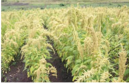
Parcela piloto de amaranto en Mariano Acosta

Entidades Participantes: Gobierno Municipal de Pimampiro, Fundación Redes, Beneficiarios de la Fase I.