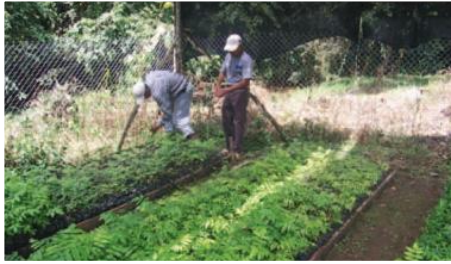
Vivero forestal parroquial en San Francisco del Vergel

Entidades Participante: Fundación FACES, Junta parroquial San Francisco del Vergel, Asociación de cafetaleros del Río Mayo, ACRIN, APECAP, Municipios de Palanda y Chinchipe.