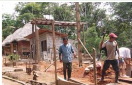
Construcción de infraestructura turística en Shayari

Las comunidades que participan del proyecto son las comunidades kichwas de Shayari (cantón Cascales), Atari (Lago Agrio) y Playas de Cuyabeno (Cuyabeno), así como la comunidad secoya de San Pablo de Katetsiaya (Shushufindi).