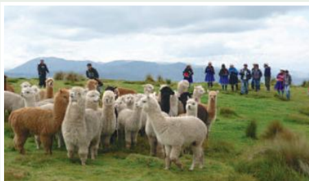
Criadero de alpacas de Sunicorral

actual como para las futuras generaciones, el proyecto plantea como objetivo general contribuir al manejo y conservación de las subcuencas de los ríos San Antonio y Guallicanga de la parroquia Juncal (Cañar), con la participación comunitaria de las organizaciones de Bunchalay Capillapata, Caguanapamba, Sunicorral, Jalupata – Gulac. A través de fortalecimiento de los procesos de gestión y manejo de los recursos naturales estratégicos (agua, suelo y biodiversidad), con la implementación de sistemas agroforestales y alternativas económicas sustentables (introducción de camélidos y turismo comunitario).