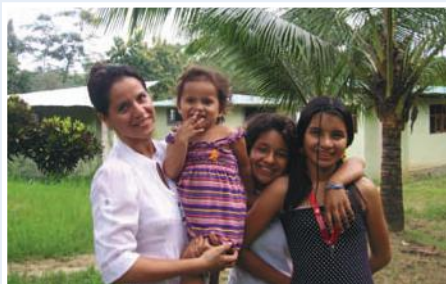
Aulas y viviendas para niños y jóvenes abandonados

En algunos casos, niñas, niños y jóvenes abandonan sus hogares o son abandonados por sus padres. En estos casos ellos están sujetos a riesgos como la explotación sexual o laboral, lo que constituye una violación a sus derechos. Este proyecto planteó promover el desarrollo integral de las niñas, niños y adolescentes, asegurando el ejercicio pleno de sus derechos, en un entorno que permita la satisfacción de sus necesidades sociales, afectivo – emocionales y culturales, involucrando a la colectividad e instituciones públicas y privadas de la parroquia.