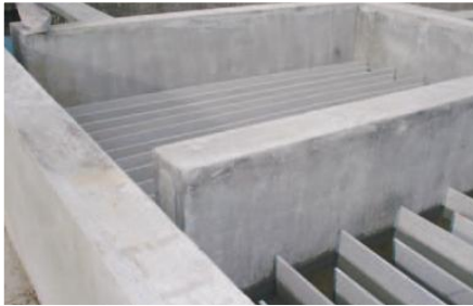
Planta de tratamiento

Entidad Solicitante y Participante: Vicariato Apostólico del Napo-Misión Josefina.