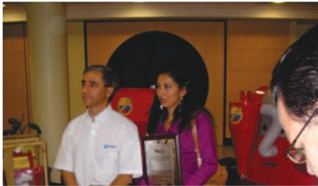
Segundo premio concurso nacional de calidad de café “Tasa Dorada” 2009, sexto lugar en el 2010.

Entidades Participantes: F. AGROECOLÓGICA AMIGOS DE LA TIERRA “FUNDATIERRA”, J. Parroquial San Antonio de las Aradas, J. Parroquial el Airo, Asociación de Productores Orgánicos de Café de Altura y Comercialización de Productos Agropecuarios de El Airo “APROCAIRO”, Junta de Regantes del Barrio de Santa Rosa.