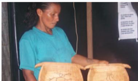
Artesana Kichwa de Cotundo, con artesanía de madera

El proyecto trata de impulsar un modelo de etnodesarrollo local para comunidades indígenas en condiciones de extrema pobreza, a través de los siguientes criterios: I) Seguridad alimentaria: garantizando la subsistencia de las familias indígenas a través de la instalación de granjas de animales menores en 15 comunidades; II) Generación de renta local: instalando talleres familiares de artesanías y senderos eco turísticos, con la participación prioritaria de mujeres y jóvenes; y, III) Revitalización cultural y ambiental: conservación del patrimonio cultural y natural, a través de iniciativas de reforestación y la instalación de sistemas agroforestales en 40 familias indígenas.