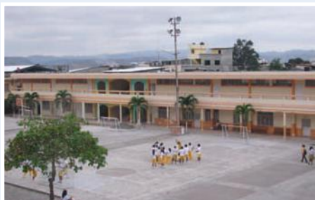
Aulas Colegio Sagrado Corazón

La provincia de Esmeraldas tiene un índice de desarrollo educativo relativamente pobre que no ha sido superado en los últimos tiempos, pese a las recurrentes campañas de alfabetización y al incremento de partidas docentes; pese a ello, la población que no tiene acceso a la educación regular está sobre el 11% especialmente en áreas rurales. El Colegio Fiscomisional “Sagrado Corazón” que hace esfuerzos por estimular la igualdad de las personas y con ello la educación participativa e incluyente, se ve imposibilitado a dar acogida a este grupo numeroso de estudiantes, por no tener la capacidad física suficiente que le permita cubrir la demanda insatisfecha que se presenta, en cada año lectivo.