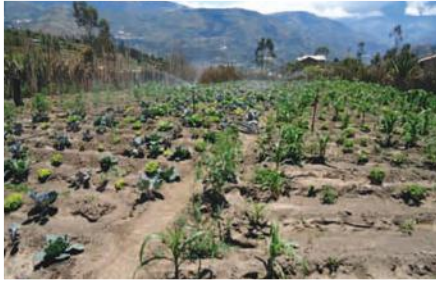
Riego por aspersión en parcela demostrativa en Sigaló.

Entidades Participantes: Ministerio de Agricultura, Ganadería, Acuacultura y Pesca MAGAP, Asociación de Juntas Parroquiales de Tungurahua, Gobierno Provincial de Tungurahua.