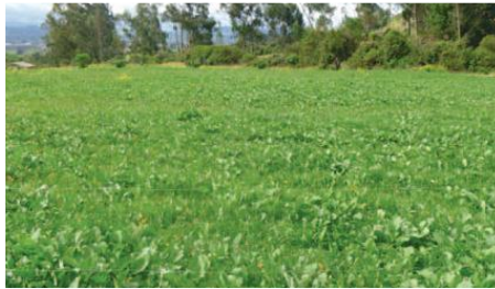
Mejoramiento de pastos, mezclas forrajeras

Entidad Solicitante y Participante: Gobierno Provincial del Carchi - GPC.