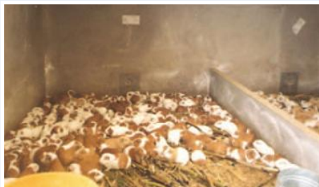
Crianza mejorada de cuyes en Tisaleo

El Proyecto buscó proteger las áreas de reserva de los páramos de Tisaleo mediante la forestación, reforestación y aplicación de sistemas agroforestales - silvo pastoriles así como incrementar los ingresos económicos de las familias mediante la asistencia técnica, capacitación y mejoramiento genético de cuyes; además, la construcción de 5 Km de empedrados, con sus respectivas cunetas, en las vías principales de Tisaleo. El componente de manejo del páramo, se ejecutó mediante la siembra de plantas forestales nativas, la protección de vertientes. Además se desarrolló sistemas agroforestales en las zonas productivas para proteger los cultivos y las praderas para la ganadería. Mejorar las condiciones de manejo, tecnología y producción de cuyes, que son actividades de mujeres mediante la entrega de machos mejorados, botiquines comunitarios y apoyo técnico.