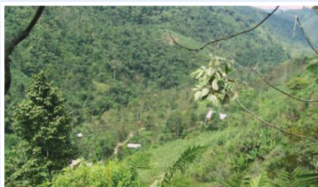
Reforestación en cuenca media del río Toachi

El proyecto planteó contribuir a la protección de la cuenca hidrográfica del río Toachi mediante la ejecución de actividades de forestación y de reforestación con especies nativas maderables y de protección propias de la zona, de manejo y aplicación de sistemas agroforestales y silvopastoriles, mejorando las condiciones ambientales y productivas de 160 familias de productores agropecuarios, complementando con un proceso de capacitación aplicativa en las