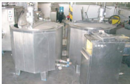
Equipos de procesamiento de lácteos en la planta de El Chaco