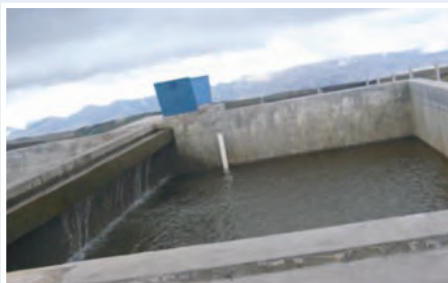
Planta de tratamiento de agua

La población se abastecía del agua de un canal abierto con piso de tierra, favoreciendo a la contaminación del agua con residuos de agroquímicos y detergentes utilizados en la limpieza de prendas de vestir, así como con excretas de animales abrevados en el canal. El 57% de familias utilizaban el agua del canal para preparación de alimentos y la higiene personal. Solo un 25% de personas disponían de agua entubada proveniente de otras vertientes, con un aprovisionamiento únicamente de dos días por semana.