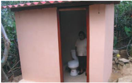
Unidad Básica Sanitaria

Entidades Participantes: Gobierno Municipal del cantón Quilanga-Comunidades Beneficiarias.