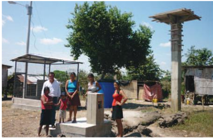
Sistema Completo: Caseta de bombeo, Transformador, Torre y Tanque Elevado, Grifo Comunitario

Entidades Participantes: Gobierno Municipal de Pedro Carbo - Recintos Jerusalem Central, Los Balzares, Santa Rosa, Jerusalem de Arriba, El Bajo, Los Corazones, La Saiba de Zamora.