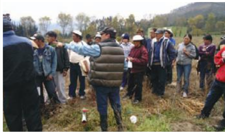
Capacitación en tecnología de riego por aspersión en la parcela, mediante intercambio de experiencias.

Entidad Participante: Gobierno Provincial del Cañar - GPC.