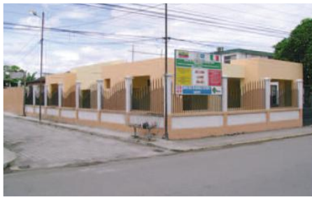
Sede de la Casa de la Malaria

Entidades Participantes: Gobierno Municipal de Francisco de Orellana-Dirección Provincial de Salud, Juntas Parroquiales del cantón- Barrios de Francisco de Orellana.