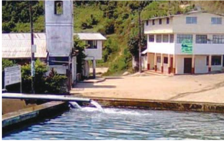
Ingreso de caudal a la planta de tratamiento del sistema de agua Potable ciudad El Corazón

Entidades Participantes: Ciudadanos de la ciudad de El Corazón, Ilustre Municipio de Pangua.