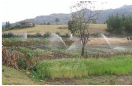
Huerto orgánico diversificado con riego por aspersión en Nabón Centro

Entidades Participantes: Gobierno Provincial del Azuay, La Municipalidad de Nabón, el Directorio del Canal de Agua de Riego San Juan Bautista de Nabón y el Comité de Riego de Chunazana.