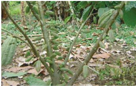
Cacao parroquia Malimpia

Entidad Solicitante: Unión de Organizaciones Negras de la Rivera del Río Esmeraldas (UONCRE). Entidades Participantes: Junta Parroquial Chura, Junta Parroquial Malimpia, Unión de Organizaciones Negras de la Rivera del Río Esmeraldas.