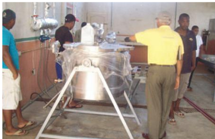
Planta procesadora de derivados de coco y caña, beneficiarios.

Entidades Participantes: Municipio de Eloy Alfaro, Microempresa Asociativa de Mujeres productoras agroartesanales de Borbón, Junta Parroquial Rural de Borbón, Federación Afroecuatoriana de Productores de Coco “FEPROCOE”.