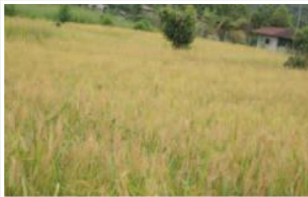
Cultivo de arroz, variedad Lira. Comunidad Nuevo Mundo.

Todos los componentes del proyecto tienen como ejes transversales la asociatividad, género y ambiente.