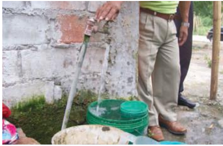
Abastecimiento de agua

Entidades Participantes: Gobierno Municipal de Santa Elena- Junta del Sistema Regional de Agua Potable de Olón, JRAPO.