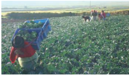
Cosecha de brócoli Parroquia San Juan

Entidades Participante: Central Ecuatoriana de Servicios Agropecuarios: Cesa; Inst. Nacional de Riego INAR-Chimborazo; Subsecretaría del Minist. de Agricultura Ganadería y Pesca-Chimborazo.