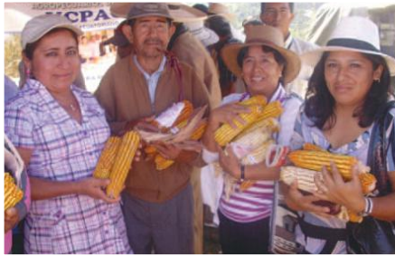
Productores de maíz criollo en Feria de Celica

Entidades Participantes: Municipios de los cantones: Pindal, Celica y Puyango; Organizaciones: Asociación de Productores AgroArtesanales de Puyango (AAPA); Corporación de Productores Agropecuarios de Pindal (CORPAP); Unión Cantonal de productores Agropecuarios de Celica, (UCPACE), Asociación de Productores Agropecuarios de Macará (APAM).