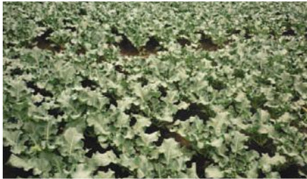
Cultivo de Brócoli en Huertos Gatazo

Entidad Solicitante: Cooperazione Internazionale - Coopi. Entidad Participante: Gobierno Provincial de Chimborazo.