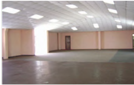
Espacio en el que se instalará el sistema de diseño y prototipado

Entidades Participantes: Cámara de Calzado de Tungurahua (CALTU), Asociación Luz del Obrero.