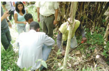
Capacitación para manejo de cultivo de cacao

El proyecto está encaminado a la atención integral a niños/as, adolescentes y familias de alta vulnerabilidad e incrementar los niveles de ingresos de las familias en el área de influencia de Lita. La Fundación Cristo de la Calle apoyada por el proyecto ha establecido estrategias de producción de cacao y maíz tanto en la finca ciudad de Gubbio de la fundación como en las fincas de los habitantes del sector, lo cual permitirá a los pobladores de Lita mejorar sus ingresos aportando a la mejora del nivel de vida. Permitirá también a la Fundación ampliar la atención que mantiene a los niños y familias en riesgo. Es importante mencionar que en la zona se trabajará de manera orgánica con la producción de bioles y humus de lombriz que permitirá no solamente obtener alimentos sanos sino también mejorar el ecosistema de la zona. Se trabajará con la producción de cacao nacional fino de aroma y se implementaran viveros para diversificar los cultivos apoyando de ésta manera la dieta familiar.