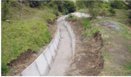
Trabajos de revestimiento de un tramo de 1900 metros del Canal de riego de Bartolomé Sacho Hacho Pullupaxi.

Entidad Participante: Gobierno Municipal de Latacunga, Gobierno Municipal de Saquisilí.