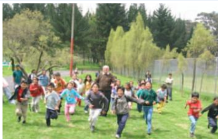
Niños beneficiarios del proyecto

El área de influencia del Proyecto “Una Escuela para la Vida - Equipamiento Talleres” cubre la zona Sur de Quito , el centro histórico de la ciudad y otros cantones como Machachi. Casi el 80% de los beneficiarios se concentra en las parroquias de Chilligallo, Guamaní, La Ecuatoriana y La Argelia. Desde el punto de vista social, la población que habita en estas zonas está constituida casi exclusivamente por inmigrantes, personas en situación de pobreza o de desintegración familiar y frecuentemente con problemas de alcoholismo, drogadicción, violencia o prostitución. Esta concentración de problemas hace que la población de estos sectores se encuentre en una situación de fuerte desventaja social y marginación y por lo tanto, sujeta a una mayor dificultad de programar y organizar su vida en relación con sus propios derechos fundamentales como la salud, la educación, la seguridad, para sí y sus propios hijos.