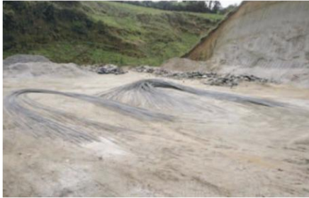
Inicio de la construcción del centro de acopio

Entidades Participantes: Gobierno Municipal de Sucumbíos, Junta Parroquial del Playón, Asamblea general de ganaderos de las parroquias del Playón y Santa Bárbara.