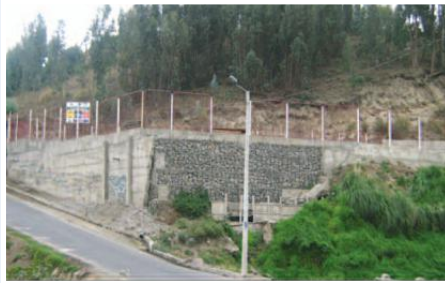
Planta de tratamiento de aguas servidas

Entidades Participantes: Gobierno Municipal de Cevallos-Comunidad del cantón Cevallos.