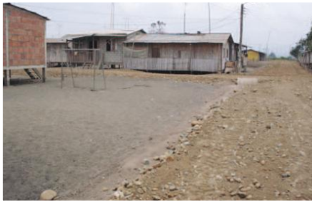
Relleno hidráulico y relleno de calles

Entidades Participantes: Gobierno Provincial de Los Ríos, Junta Parroquial de Caracol, Junta Administradora del Proyecto.