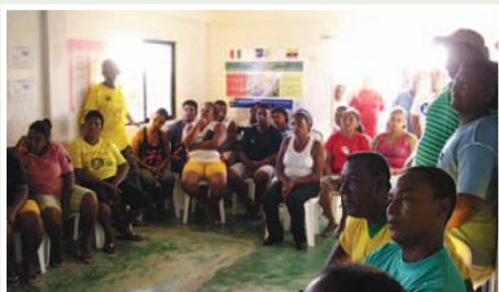
Reunión con las nuevas organizaciones de pescadores