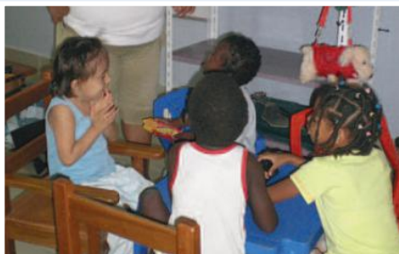
Terapia a niños con capacidades especiales

En el Ecuador, las estadísticas del CONADIS reportan que existen 1.608.334 personas con alguna discapacidad, que representa el 12,14% de la población nacional. 184.336 hogares ecuatorianos cuentan con al menos una persona con discapacidad. Según el censo de población realizado en el año 2001, en el cantón de Esmeraldas el 6,52% que representa 16.341 habitantes, de su población tiene problemas de discapacidad. De este porcentaje de población discapacitada el 10,91% que equivale a