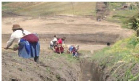
Adecuación Reservorio 6500 m 3 / Instalación Tubería red principal

El proyecto busca incrementar la producción y productividad agropecuaria de los cultivos de mora, fresa, uvilla, hortalizas, pastos y animales menores, mediante la optimización del uso de agua para riego, mejorando la tecnología agropecuaria y la comercialización de la producción que se genere en las chacras indígenas. Se mejorará la infraestructura de riego, incrementando la capacidad de reservorios, entubando las redes principales y secundarias para optimizar la conducción de agua para riego, así como incorporando nuevas tecnologías de riego a nivel parcelario (aspersión y/o Goteo. Se beneficiarán 108 familias indígenas de escasos recursos.