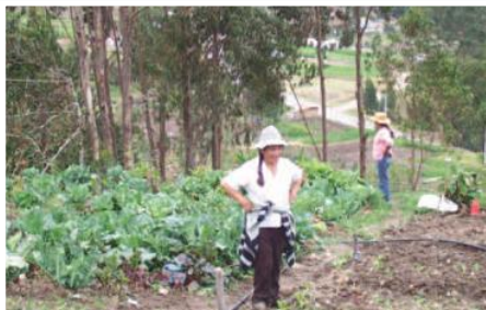
Huerto de hortalizas orgánicas con riego presurizado en Nabón

El proyecto inició el 10 de mayo de 2007 y concluyó en diciembre 2008. Contempló la instalación de un sistema presurizado de riego en beneficio de 300 usuarios distribuidos en 9 sectores, que integran la Junta de Riego de San Juan Bautista de Nabón en el cantón Nabón, Azuay; con una superficie neta de 257 Ha de riego, distribuidas en 6 ramales. El sistema fue previsto inicialmente para el funcionamiento del canal principal a gravedad, pero el proyecto se rediseñó para disponer de infraestructura y redes de distribución secundarias y terciarias a presión en una