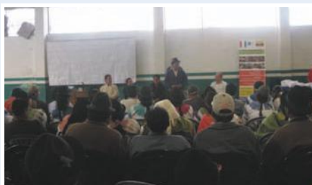
Reunión de beneficiarios del proyecto en Simiátug

Contribuir a la gestión y democratización de las Finanzas Populares de las familias campesinas pobres de 6 cantones de las provincias de Imbabura, Sucumbíos, Cotopaxi y Bolívar, fortaleciendo la capacidad operativa existente de las estructuras financieras locales para promover servicios financieros ágiles y oportunos, orientados a la inversión familiar y asociativa de empresas productivas sostenibles y rentables.