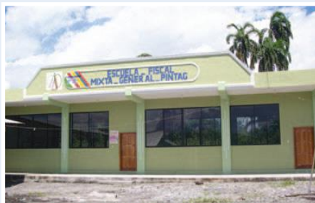
Aulas de la escuela Píntag, Colonia Azuay.

El proyecto se formuló para contribuir al mejoramiento de la educación y de las condiciones de vida de los pobladores de las comunidades Yutzo y colonia Azuay de la parroquia Arapicos, del cantón Palora, provincia de Morona Santiago. A través del incremento de la cobertura de agua potable y saneamiento en la comunidad de Yutzo, mejoramiento de la calidad del servicio de agua potable en Colonia Azuay, mejoramiento de la infraestructura educativa en la comunidad de Colonia Azuay y mejoramiento de la seguridad vial de los habitantes de la parroquia Arapicos.