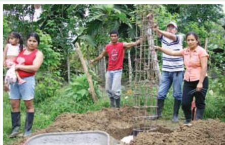
Construcción tanque elevado para el vivero en Bilsa

El objetivo del proyecto es contribuir al mejoramiento económico y optimar las condiciones de vida de los pueblos del cantón Muisne, mediante el fortalecimiento de la soberanía alimentaria y apoyando a la recuperación de los ecosistemas marino costeros de la zona dentro de los marcos establecidos en el Plan Nacional de Desarrollo del Ecuador, de esta manera se incrementará el ingreso económico de 320 familias campesinas mediante el fortalecimiento de la producción agroecológica logrando disminuir la brecha entre los ingresos y la canasta básica, incluyendo productos básicos y rentables a lo largo de la cadena de valores en el respeto del medio ambiente.