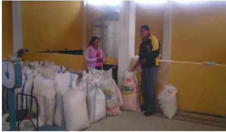
Procesamiento de granos en CNC de Sigchos

Entidades Participantes: Camari, Gobierno Municipal de Sigchos, Junta parroquial de Cusubamba.