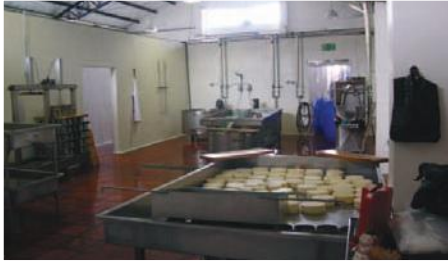
Planta de Lácteos instalada y funcionando en Sigchos-Cotopaxi.

Entidad Solicitante y Participante: Gobierno Municipal de Sigchos - GMS.