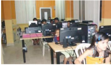
Cursos de Computación CADIS

Entidades Participantes: Gobierno Provincial de Manabí (GPM); Agencia de Desarrollo de la provincia de Manabí (ADPM); Gobiernos Parroquiales: Chibunga, Cojimíes, Membrillo, 10 de Agosto, Campozano, El Anegado, Machalilla, La Unión, Noboa.