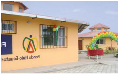
Módulos de vivienda

Entidades Participantes: Fundación San Vicente de Paúl-Vicaría de la Arquidiócesis de Portoviejo, Beneficiarios del proyecto.