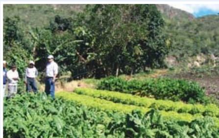
Capacitación en cultivos hortícolas en la comunidad de Peñaherrera, manejo de sistemas de riego por aspersión.

El proyecto está direccionado a contribuir al mejoramiento de la calidad de vida de 11 comunidades indígenas vinculadas a la Cooperativa Cochapamba, potencializando el desarrollo territorial a través del uso adecuado de los recursos naturales, el fomento de las actividades productivas y la capacitación de sus habitantes. La zona de influencia del proyecto abarca las parroquias de Ambuquí y El Sagrario, en las comunidades de: Pogliocunga, Chaupi, Manzano, Cachipamba, Apangora, Rancho Chico, Peñaherrera y Guaranguicito, apoyando aproximadamente a 531 familias de la zona. El proyecto ha contribuido con la protección de fuentes de agua mediante la reforestación y cercado, se han realizado talleres de concientización para evitar las quemas de bosques y páramo, se ha podido recuperar suelos improductivos mediante técnicas de rotura de cangahua, se han realizado reservorios familiares, se tienen establecidos sistemas presurizados para riego por aspersión, están establecidas parcelas hortícolas, se ha contribuido al mejoramiento de la producción de leche en la zona con la introducción de ganado que corresponde a un cruce entre criollo y holstein. Se apoyó con microcrédito a emprendimientos no agrícolas como son el establecimiento de panaderías, tiendas, talleres, etc.