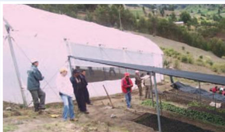
Vivero Agroforestal en Guamote

Se pretende contribuir al mejoramiento de las condiciones ambientales en la subcuenca del Río Chambo, mediante la forestación y reforestación de áreas con aptitud forestal y agroforestería en parcelas de campesinos indígenas, utilizando especies nativas y exóticas y forestar y reforestar 1080 ha con plantas de especies nativas para protección y exóticas para producción, en sistemas de bosque y agroforestería, en seis cantones integrantes de la microcuenca del Río Chambo, provincia de Chimborazo.