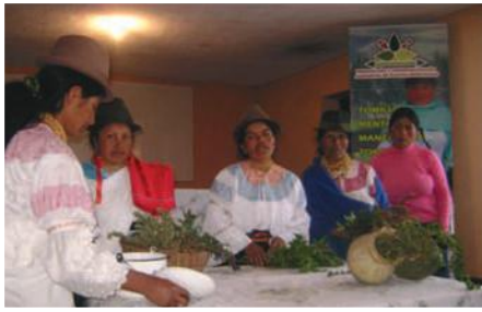
Taller de lanzamiento

Entidades Participantes: Orden Capuchina en el Ecuador, Gobierno Provincial de Imbabura.