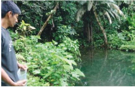
Cría de cachama

Entidades Participantes: Asociación de productores de café y cacao El Eno, APROCCE (Asociación Artesanal de Productores de Café y Cacao del Eno).