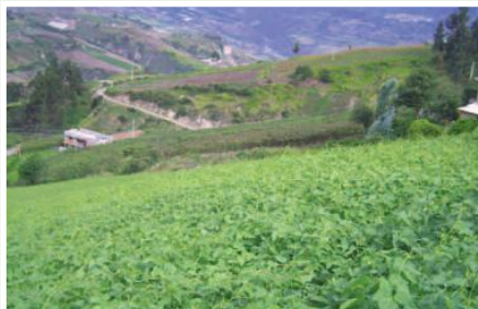
Cultivo de fréjol en los valles de los ríos Mira y Chota

El proyecto se ejecuta en la provincia del Carchi, cantones de Bolívar y Mira, en las parroquias: La Concepción, Juan Montalvo, Jijón y Caamaño, Mira, San Vicente de Pusir, García Moreno, Los Andes y San Rafael.