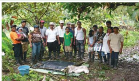
Taller agricultura orgánica comunidad Tortuga, preparación de Bocashi.

El proyecto está ubicado en la provincia de Esmeraldas, cantón Muisne, parroquia San Gregorio. La propuesta de reformular este proyecto, parte de la necesidad de generar una nueva forma de intervención desde los propios productores que irradie hacia todo el sector del cacao. El proyecto se basa en el reconocimiento de que el Ecuador es el único productor del mejor cacao del mundo como es el “Cacao Arriba Ecuador”, como también de cacao fino de aroma. El objetivo es contribuir al mejoramiento de los ingresos económicos de las familias campesinas de la parroquia San Gregorio del cantón Muisne, a través de un manejo agronómico tecnificado del cultivo de cacao. Se propicia la aplicación de los conocimientos adquiridos a nivel de finca, se establecerán al menos cinco viveros de cepas promisorias para su distribución y repoblamiento que sustituya progresivamente a las híbridas introducidas y a las nacionales sin características de cacao Arriba, conforme estas cumplan su vida útil vegetativa.