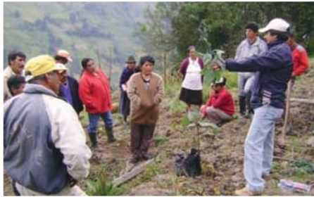
Capacitación a beneficiarios en reforestación

Entidades Participantes: Municipio de Pimampiro, Fundación REDES y Juntas Parroquiales de Chugá, San Francisco de Sigsipamba y Mariano Acosta.