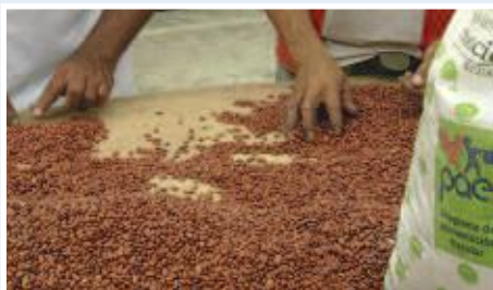
Selección manual de fréjol para ventas al MIES

El proyecto planteó combatir la pobreza, mejorar la calidad de vida y promover el desarrollo sustentable de 300 familias de Mocache asociadas a la Unión de Organizaciones Campesinas de Quevedo (UOCQ), mediante un sistema de procesamiento y comercialización de granos, vinculado prioritariamente al programa Aliméntate Ecuador del Ministerio de Inclusión Económica y social MIES. Se buscó consolidar la producción de 300 fincas diversificadas de igual número de familias, a través de la articulación directa al mercado de dos productos, mediante la instalación de un centro que procese arroz y fréjol y los provea como alimentos sanos prioritariamente a las familias participantes y los excedentes a los programas de ayuda alimentaria del MIES.