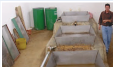
Producción de panela granulada en la planta de San José de Mercadillo

El proyecto promovió el mejoramiento de las condiciones de vida de 300 cañicultores de Puyango, impulsando la cadena agroindustrial de la caña de azúcar por medio de: a) Fomento a la producción agroecológica; b) Implementación de 2 plantas procesadoras de panela; c) Organización de una empresa asociativa de comercialización de la panela. Las estrategias de intervención contemplaron capacitación en manejo agroecológico, industrialización de la caña de azúcar y operación de las plantas procesadoras, implementación de sistemas de riego por aspersión y goteo para 50 Ha, certificación orgánica en fincas, estructuración del sistema de comercialización de la Panela, así como la operación de un sistema de microcrédito productivo.