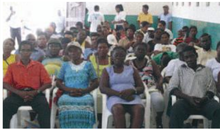
Asistentes al acto de lanzamiento del proyecto en San Lorenzo

Entidades Participantes: Municipio de San Lorenzo, Junta Parroquial de Santa Rita, Junta Parroquial de Ricaurte Tululbí.