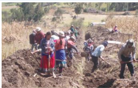
Excavación de zanjas realizada por la comunidad

El cantón Cañar, y particularmente la parroquia de Juncal es una de las áreas más deprimidas en lo que tiene que ver con niveles de pobreza, llegando a un 97,5% de pobreza por necesidades básicas insatisfechas. Según indicadores del SIISE (2002), la parroquia de Juncal a la que pertenece la comunidad de Charcay, tiene un déficit de alguno de los servicios básicos igual a 99,8%, solo un 8,9% tiene servicio higiénico exclusivo y un 13% de las viviendas tienen sistema de eliminación de excretas a través de pozos sépticos. La carencia del servicio de eliminación de excretas para la mayoría de