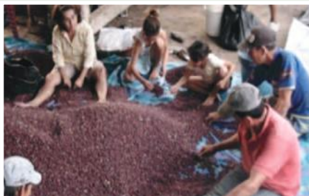
Selección manual de maní en la parroquia Lascano

El proyecto tiene como finalidad mejorar la rentabilidad de los sistemas de producción y comercialización de 350 familias de las parroquias Lascano (200) y Noboa (150), de la provincia de Manabí, a través de la generación de varios servicios de apoyo a la producción y comercialización. Se ha logrado gestionar ante el MIES recursos económicos para iniciar el procesamiento del maní. Con la implementación del proyecto se espera incrementar la rentabilidad de los sistemas de producción de 350 pequeños y medianos productores agropecuarios, por medio del incremento de ingresos en al menos 30%.