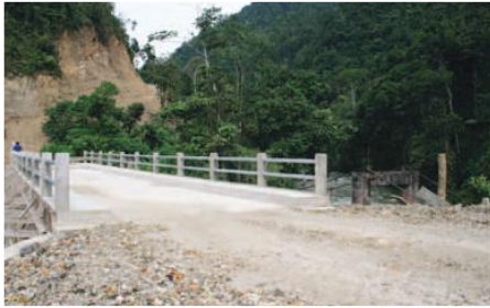
Puente sobre el río Kalaglas

Entidades Participantes: Gobierno Municipal de San Juan Bosco- Junta Parroquial de San Jacinto de Wakambeis-Pobladores de Wakambeis.