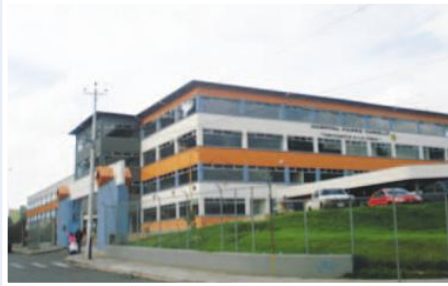
Hospital Un Canto a la Vida

Entidades Participantes: Fundación Tierra Nueva-Administración Zonal Quitumbe-Comunidad Nueva Aurora del Sur de Quito.