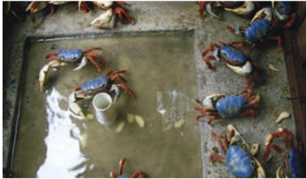
Cochiquero para el engorde de cangrejo azul.

Entidades Participantes: COPSON, La Junta Parroquial de La Tola, la Cooperativa de Producción Pesquera Artesanal “Ancón de Sardina”, la Cooperativa de Producción Pesquera Artesanal “AGROPESTUR”, la Cooperativa de Producción Pesquera Artesanal “8 de Noviembre”.