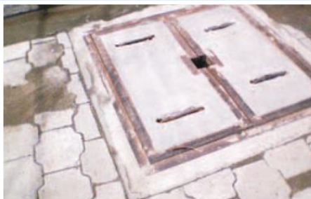
Readoquinamiento luego de colocación de tuberías y construcción de cajas de acera

El 100% de moradores de la cabecera parroquial se abastecía de agua acarreada del Río Los Tingos, con un gasto promedio mensual de U.S. $ 15, por acarreo de agua. Según reportes del Subcentro de Salud del Ministerio de Salud Pública, la utilización de esta agua no apta para el consumo humano, traía como consecuencia que anualmente 250 pacientes tengan síndrome diarreico, 190 pacientes con Gastroenteritis, 270 pacientes con Dermatitis.