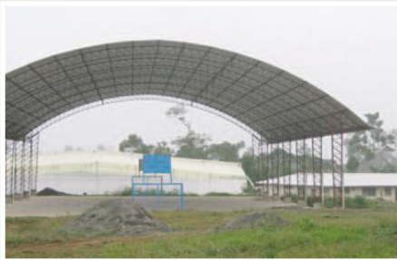
Talleres, cancha y Centro de Rehabilitación

Entidades Participantes: Fundación Su cambio por el cambio-Gobierno Provincial de Santo Domingo-Comité de Padres de Familia de Niños y Jóvenes Beneficiarios.