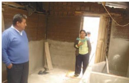
Cuyera en construcción

El proyecto busca fomentar y estructurar una cadena agro productiva, para desarrollar un programa de economía solidaria, para manejar y multiplicar cuyes de calidad, luego comercializar en forma asociada, en el mercado local y nacional, por lo tanto se enfatizará en el fortalecimiento de la capacidad de gestión local, con el propósito de transformar los productos en insumos para alimentación de los cuyes, comercializar en forma asociada, mantener la interrelación con entidades del sector. Para ello trabajará tanto con los gobiernos locales (juntas parroquiales), como con las organizaciones sociales, manteniendo como referente los planes de desarrollo parroquiales y provinciales, promoviendo la participación ciudadana en los espacios institucionales.