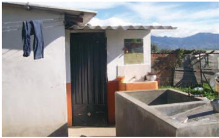
Unidad Básica Sanitaria

Entidades Participantes: Gobierno Provincial del Carchi-Juntas Parroquiales de Sta. Marta de Cuba, Cristóbal Colón, Julio Andrade-Beneficiarios del Proyecto.