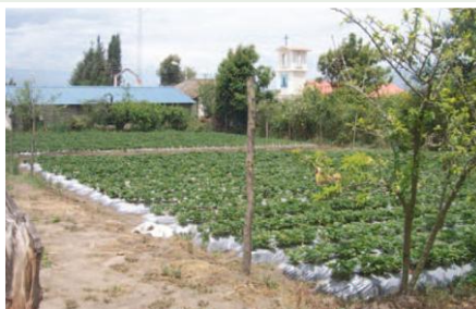
Cultivo intensivo de fresas con riego por goteo

El Programa de Desarrollo Social y Ambiental financiado por el FIE se ejecuta en dos fases: la primera se implementó desde junio/2007 a octubre de 2008. Los logros obtenidos en esta fase, justificaron la propuesta de financiamiento de una segunda etapa, la cual fue aceptada por el FIE en su 3° convocatoria. La fase II inicia en noviembre/2009 y está previsto ejecutarse hasta abril/2011. En esta fase se espera incrementar los ingresos económicos agropecuarios de las 1.450 familias hasta U.S. $ 2.050 por medio del mejoramiento de la productividad, acceso a crédito, riego presurizado (60 upas dispondrán de riego presurizado), generación de valor agregado, comercialización asociativa (el 80% de la oferta de cuyes se comercializarán asociativamente a través de la planta de faenamiento), protección y manejo de páramo.