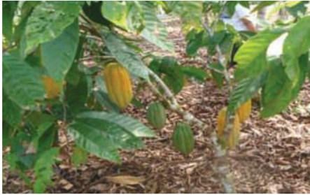
Plantación de cacao tipo nacional mejorada

Entidades Participantes: Gobierno Municipal del Putumayo, Gobierno Provincial de Sucumbíos.