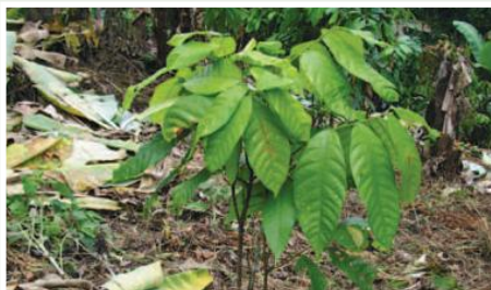
Nueva siembra de cacao fino aroma

Se busca construir una cadena de cacao, principalmente de cacao fino y de aroma, por ser el que más se ha sembrado en la zona y tiene mejores precios en el mercado internacional y más estables. Para ello se mejorará los rendimientos y la producción mediante un buen manejo de las fincas y siembras adicionales. También se realizará una cosecha y pos cosecha adecuada, que conserven la calidad del cacao.