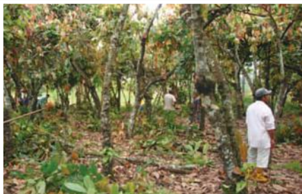
Rehabilitación de huerto de cacao nacional en Mocache

El proyecto beneficiará a familias, pertenecientes a la Corporación de Agricultores Mocache (CAM), organización que tiene como actividad productiva principal la producción de cacao nacional fino y de aroma. El proyecto inició sus actividades en abril de 2010. Tiene su área de intervención en el centro occidental de la Provincia de Los Ríos a 28 Km. de Quevedo y al Sureste del mismo (cantón Mocache). Se tiene planeado llegar a dar asistencia a 326 familias de 10 organizaciones pertenecientes a la Corporación de Agricultores Mocache (CAM), con un total de 326 Ha de cacao fino y de aroma manejadas con miras a incrementar la productividad del cacao a por lo menos 10 qq/Ha. Así mismo, se construirá un centro de acopio y comercialización de cacao con capacidad de procesar inicialmente 1.200 qq de cacao por año.