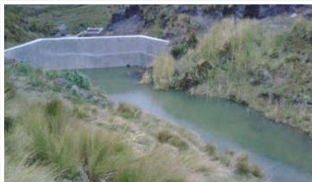
Construcción de captación de agua

El objetivo del proyecto es mejorar el nivel de vida de las comunidades de Maca Grande que en total lo constituyen 780 unidades productivas agropecuarias con el mejoramiento e incremento de la producción agrícola aprovechando los beneficios que aportaría el sistema de riego por aspersión a construirse el mismo que tiene una conducción principal de 14,5 km de longitud, una red de distribución de 45 km de longitud y 450 acometidas a cada uno de los lotes.