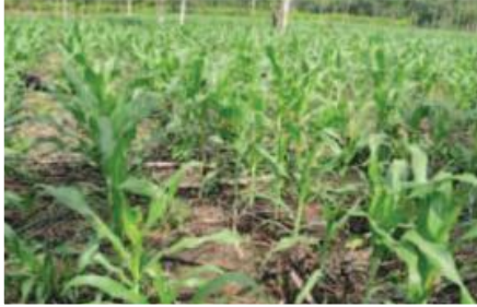
Establecimiento de 300 Ha de Maíz

Entidad Solicitante: Centro de Investigaciones y Servicios Agropecuarios de Sucumbíos (CISAS). Entidades Participantes: Gobierno Provincial de Sucumbíos, Centro de Investigaciones y Servicios Agropecuarios de Sucumbíos (CISAS).