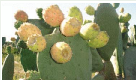
Tuna, variedad amarilla

incorpora zonas de secano del territorio ancestral afro ecuatoriano de Chota – Mira, no aptas para otros cultivos, a través de la tecnificación del manejo de la tuna para la comercialización asociativa de su fruta fresca. Ampliación de la cobertura del sistema de ahorro y crédito comunitario manejado por una entidad financiera local, además del mejoramiento de un centro de acopio y comercialización de tuna.