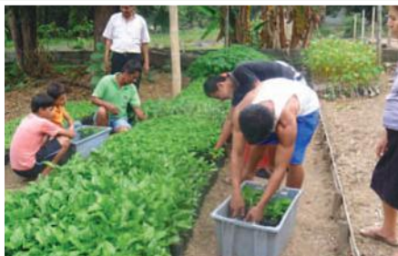
Producción de plantas de cacao nacional en vivero comunitario

El proyecto pretende promover la inclusión productiva y social y la cohesión social de los campesinos de las comunidades afectadas por la represa Daule Peripa, pertenecientes al cantón El Empalme, a través de incrementar la rentabilidad de los sistemas de producción de pequeños y medianos productores agropecuarios, de tal manera que al finalizar el proyecto, en por lo menos el 60% de las familias beneficiarias, la brecha entre ingresos agrícolas y costo de la canasta básica se haya reducido al 20%.