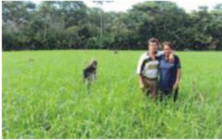
Arroz de 35 días de sembrado

Entidades Participantes: Gobierno municipal del Putumayo, agricultores y pequeños productores de Santa Elena.