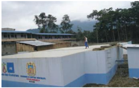
Sistema de agua potable Montalvo

Entidades Participantes: Municipio del cantón Montalvo, Cooperacion Internacional COOPI.