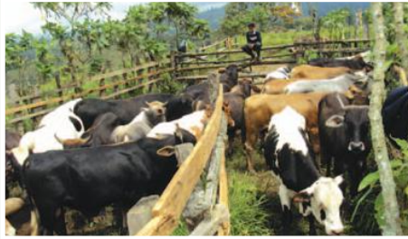
Encierro de toretes para aplicar desparasitantes

Entidades Participantes: Gobierno Municipal de Sigchos; Junta Parroquial de Las Pampas.