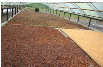
Marquesina para secado de cacao, café y maíz en el centro de acopio Tres de Noviembre.

El proyecto apunta a mejorar la productividad y comercialización de los cultivos de cacao, café y maíz, mediante el fortalecimiento a dos centros de acopio ubicados en las parroquias San Carlos y Tres de Noviembre pertenecientes al cantón Joyas de los Sachas. Actualmente el proyecto ha terminado la injertación de plantas de cacao en el campo y ha producido 42.000 plantas en viveros para ser transplantadas. Se está trabajando en los cultivos de café y se ha implementado una bodega para el acopio de cacao, café y maíz en Sacha así como también se han mejorado las instalaciones en el centro de acopio Tres de Noviembre que permita tener una calidad homogénea de los productos acopiados. Se ha establecido un sistema de microcrédito el mismo que se encuentra funcionando efectivamente con una tasa de morosidad del 0% gracias a la metodología utilizada por la cooperativa Mushuk Kawsay.