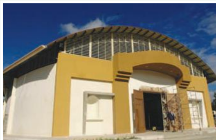
Centro de capacitación

El proyecto pretende realizar acciones que contribuyan a generar capacidades técnicas locales, desde una propuesta de educación para la vida, en los barrios; Ciudadela del Operador, Colinas Lojanas, Reinaldo Espinoza, Juan José Castillo, Chontacruz y Punzara Chico, en los dos años de ejecución del proyecto, se dará respuesta a un problema latente en la zona como es la escasa capacitación técnica.