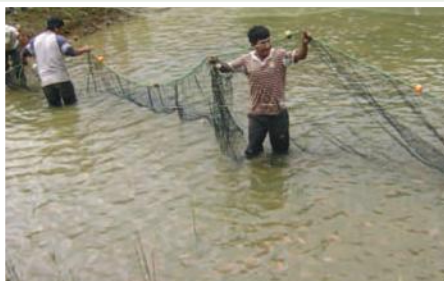
Separación de tilapia a estanques de engorde Centro Shuar Napurak.

El proyecto está direccionado a mejorar las condiciones de vida de 8.550 habitantes pertenecientes a los cantones Nangaritza, Yantzazá, El Pangui, Yacuambi, Paquisha, Zamora, Centinela del Cóndor y a las comunidades de Guadalupe, La Paz, Chicaña, Los Encuentros, Bella Vista, El Guismi, Tundayme, El Pangui, Zumbi y Zurmi, mediante la implementación de granjas integrales para la producción de pollos, peces, cerdos que mejorarán la dieta familiar, y un vivero forestal que permita apoyar a la reforestación y protección de fuentes de agua. Además la capacitación administrativa para el manejo adecuado de las fincas y pequeños negocios, permitirá a los habitantes mejorar sus ingresos. Asimismo, salvaguardar los territorios ancestrales que permitan a la comunidad Shuar, a través de sus diferentes centro, mantener su identidad.