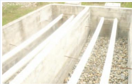
Tanques de almacenamiento de agua

Guare es una de las parroquias con mayor carencia de servicios básicos y altos índices de pobreza. Según los datos del Sistema Integrado de Indicadores Sociales del Ecuador (SIISE), el 97,86% de su población vive en condiciones de pobreza determinada por necesidades básicas insatisfechas. En lo que respecta a eliminación de excretas, el 91,42% de la población que vive en la cabecera parroquial de Guare no cuenta con servicio de alcantarillado y la eliminación de excretas se la realiza por pozos ciegos y sépticos, lo cual trae serios problemas de salubridad en la zona. Además, Guare es la parroquia con mayor índice de pobreza de toda la provincia de Los Ríos. La parroquia Guare, carece de una atención adecuada de infraestructura sanitaria y sus habitantes en forma general se abastecen de pozos, de ríos y acarreos, incrementándose de esta forma los problemas de salud que afectan a los pobres, principalmente a los niños y a las mujeres. Con el fin de mejorar las condiciones de salubridad en que viven las personas de la cabecera parroquial de Guare, se determinó que un proyecto de alcantarillado sanitario para esta zona, era de vital importancia el mismo que se planteó como objetivo específico, el dotar al 100% de las viviendas de la cabecera de la parroquia Guare de alcantarillado sanitario, que permita a sus habitantes, la eliminación de excretas de forma que no comprometa las condiciones ambientales y salubres en que se desarrollan las actividades en este sector.