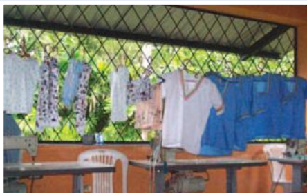
Prendas elaboradas en el taller de costura de la mujer Shuar.

El proyecto contribuye a mejorar las condiciones de vida de las familias kichwas del cantón Loreto, provincia oriental de Orellana a través de iniciativas empresariales productivas, favoreciendo la participación de la mujer en igualdad de oportunidades en el ámbito social, económico y cultural. Se han desarrollado actividades en las que la mujer maneja emprendimientos productivos como la cría de pollos y un taller de costura, los mismos que se encuentran establecidos y produciendo ingresos. Por otro lado se ha implementado el Sasina restaurant manejado por jóvenes Kichwas que es parte de otro emprendimiento turístico implementado por el proyecto denominado la Ruta Kichwa de la cual forman parte cabañas localizadas en Chonta Cocha y en Verde Sumaco, manejadas por los integrantes de cada una de las comunidades. El emprendimiento turístico es apoyado con la capacitación a los profesores de la zona mejorando las mallas curriculares. Igualmente se ha implementado un sistema de microcrédito manejado por una cooperativa local con la finalidad de introducir en los Kichwas el manejo administrativo de sus chacras que les permita mejorar tanto su dieta alimenticia como su economía.