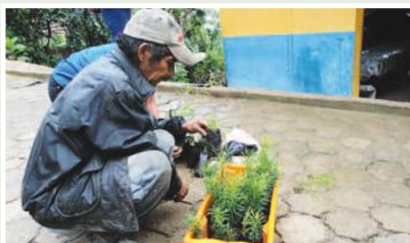
Plantas para reforestar y proteger la vertiente.

El proyecto parte de la necesidad de proteger las cuencas para evitar mayor erosión y pérdida de las fuentes de agua, pero se basa en la introducción de mejoras tecnológicas y de infraestructura de riego a fin de incrementar la producción y los ingresos de los agricultores. Propone un manejo integral de las fincas, incluyendo reforestación, y comercialización conjunta. Para ello, es menester crear organizaciones de productores o fortalecer las existentes, crear estructuras para la provisión de crédito y buscar el apoyo de las Juntas Parroquiales para que colaboren con el desarrollo local.