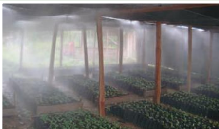
Riego por nebulización en un vivero de café

Este proyecto es una propuesta agro-productiva y de desarrollo organizacional que contribuye al mejoramiento de las condiciones y calidad de vida de 400 pequeños y medianos productores/as de café en cinco cantones fronterizos (10 Parroquias) de la Región Sur Oriental de la Provincia de Loja, a través del mejoramiento, del proceso de producción orgánica diversificada en sistemas agroforestales, cosecha, poscosecha y comercialización asociativa de café y fruta de chirimoya, en pequeñas y medianas fincas cafetaleras, agrupadas en 20 grupos de interés, y del fortalecimiento de la organización PROCAFEQ, que los agrupa.