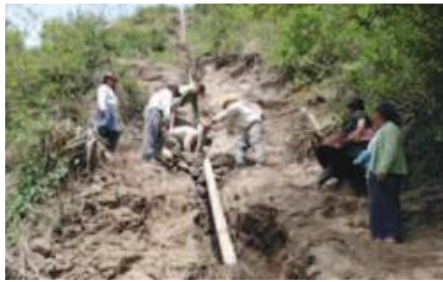
La comunidad trabajando en la construcción del sistema de agua Chipungales.

Entidades Participantes: Junta de agua potable Chipungales-San Gerardo, Honorable Consejo Provincial de Chimborazo.