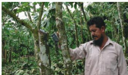
Poda de rehabilitación en finca de cacao en La Maná

El cantón La Maná presenta altos índices de pobreza de la población no obstante la existencia de generosos recursos naturales propicios para el desarrollo del sector agropecuario. Las características agroecológicas determinan alta potencialidad para el desarrollo del cultivo del cacao, sin embargo, debido al desconocimiento de técnicas mejoradas de producción, los rendimientos actuales son inferiores al promedio nacional. A lo anterior se suma la cadena de comercialización que castiga al productor y la débil organización campesina. En esas condiciones el proyecto se propone el mejoramiento de la cadena productiva del cacao, como medio para incrementar el ingreso de las familias. Se han definido cuatro ámbitos de acción: mejoramiento de la producción, instalación de un centro de acopio y procesamiento de cacao, comercialización asociativa y fortalecimiento organizacional.