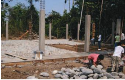
Construcción centro de acopio en San José de Morona

Entidades Participantes: Asociación de productores Cacaoteros de San José de Morona, Fundación Chankuap.